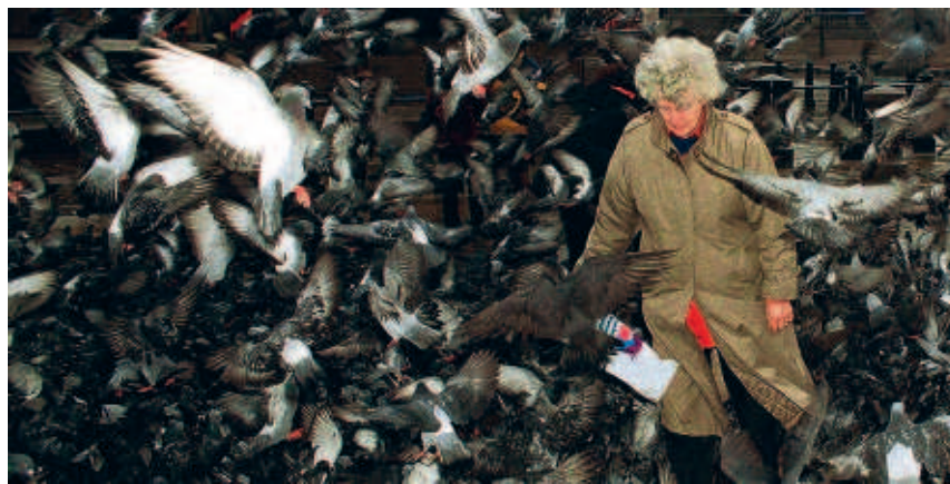
■ TRAFALGAR SQUARE IN LONDEN: VERBODEN DE DUIVEN TE VOEDEREN