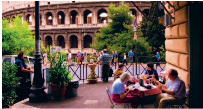
■ HET OUDE CENTRUM IN ROME: VERBODEN TE PICKNICKEN, TE ROEPEN EN BUITEN TE SLAPEN

Het toenemende aantal beperkingen in almaar meer steden kan de modale toerist afschrikken. Daar staat tegenover dat citytripbestemmingen de kapitaalcrachtigere vakantieganger terugwinnen, die vindt dat het in een stad best wel wat rustiger mag. Dat kan natuurlijk ook de verborgen strategie zijn die achter de maatregelen steekt.