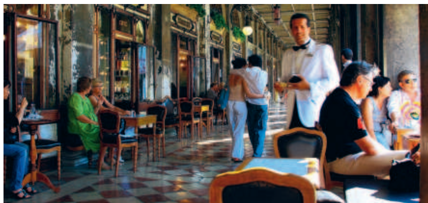
■ CAFE FLORIAN OP HET SAN MARCOPLEIN IN VENETIË: VERBODEN BUITEN DE TERRASJES TE ETEN EN ROND TE LOPEN MET ONTBLOOT BOVENLICHAAM