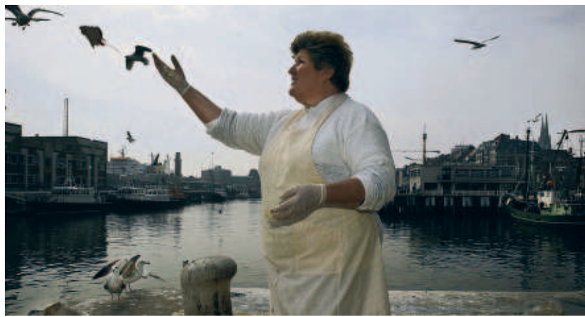
■ DE VISSERSKAAI IN OOSTENDE: VERBODEN DE MEEUWEN TE VOEDEREN